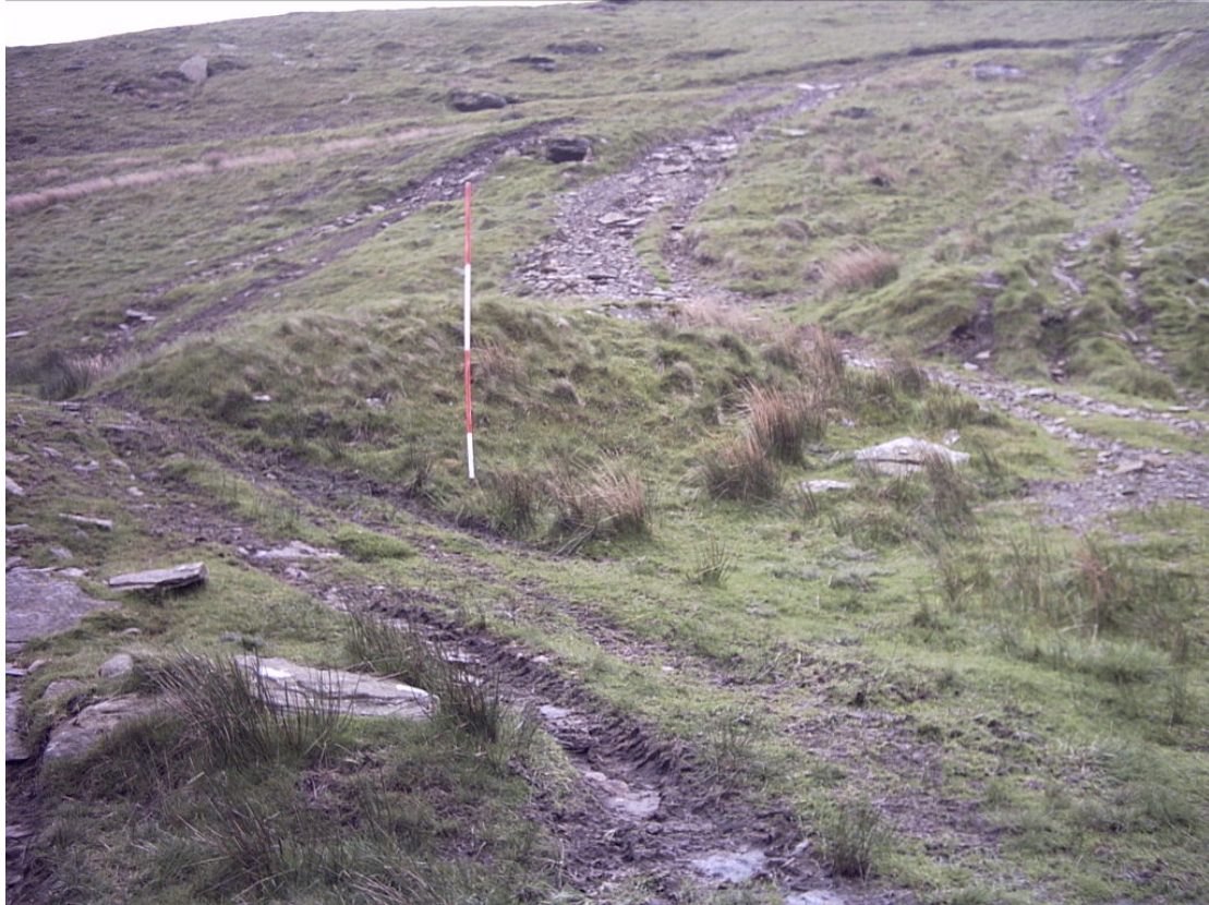
Arglawdd Croes-Grib Bwlch y Clawdd SAM GM 500, tynnwyd rhan i ffwrdd ger y llwybr mynediad a threuliwyd ymhellach o ganlyniad i bwyntiau croesi cerbydau.

Cafwyd problemau wrth samplu'r saith safle, gan fod bron pob un o'r lleoliadau sampl wedi'u rhwystro gan gerrig o wahanol ddyfnderoedd. Byddai hyn, felly, yn awgrymu bod y rhan fwyaf o Argloddiau Croes-grib De Ddwyrain Cymru wedi'u creu o garreg neu o leiaf fod ganddynt lefel uchel o gerrig ynddynt. Yn wir, gwnaeth cloddio Bedd Eiddil ganfod llechfeini tywodfaen mawrion a oedd yn cael eu defnyddio fel gorchudd dros glawdd gwrthglawdd, ac mewn mannau gwnaeth atal y math mwyaf penderfynol o samplu. Yn hyn o beth, dysgwyd bod y math yma o samplu yn ddull aneffeithlon o werthuso. Byddai cloddio ar raddfa fach, wedi'i dargedu yn benodol, yn ddull asesu mwy effeithlon.