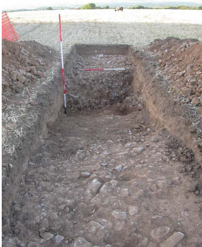
Lloc Norton, adran o'r ffos wedi'i gloddio'n rhannol

Darganfuwyd beddrod siambr Graig Fawr (SAM Gm 513) yn 1989, mae'n cynnwys dwy siambr fonolithig ar wahân â thwmpath sydd wedi diflannu. Rhagwelwyd y byddai arolwg o'r cyfuchlinau agos at ei gilydd ar y gofadau yn darparu cofnod cywir o'r siambrau a lleoliad posib y twmpath gwreiddiol, fyddai yn ei dro yn caniatáu ehangu'r ardal restredig. Dangosodd canlyniadau'r arolwg ddwy siambr (A a B) c3m ar wahan, wedi'u ffurfio o slabiau cymharol fach a