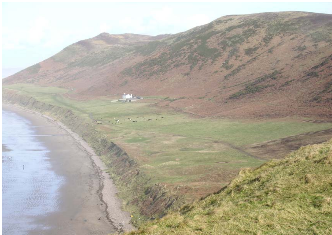
HLCA Tirwedd Hanesyddol y Gŵyr 008 Bae Rhosili [l] 013 Rhimyn Arfordirol Amgaeedig Rhosili Isaf [c] a 023 Twyn Rhosili [r]

Harddwch Naturiol Eithriadol hon, y gyntaf ym Mhrydain (1956), ceir safleoedd archaeolegol o bron bob cyfnod, o ogofau preswyl Uwch Balaeolithig i gestyll canoloesol a thirwedd parcdirol o'r 18fed ganrif a henebion diwydiannol, sy'n cynnig microcosm eithriadol o gyfoeth hanesyddol Cymru. Ceir dynodiadau pwysig eraill fel Ardaloedd Cadwraeth a Henebion Hynafol Rhestredig.